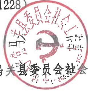
马关县委员会社会工作部