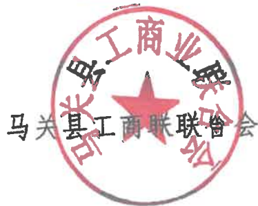
马关县工商联联合会