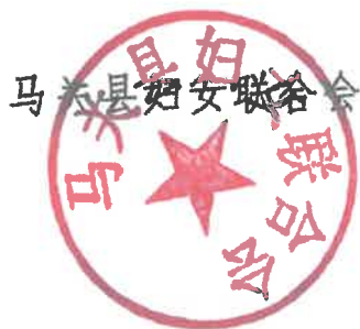
马关县妇女联合会