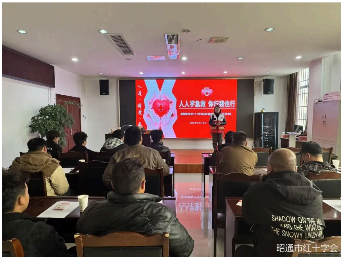
市红十字会应急救护培训专场

新春佳节暖意浓，应急救护护民生。春节及元宵期间，昭通市红十字会统筹全市红十字力量，深入校园、社区、企业，聚焦新业态群体与高危行业，推动急救知识全域覆盖、技能实用落地，用心用情守护群众平安过节。